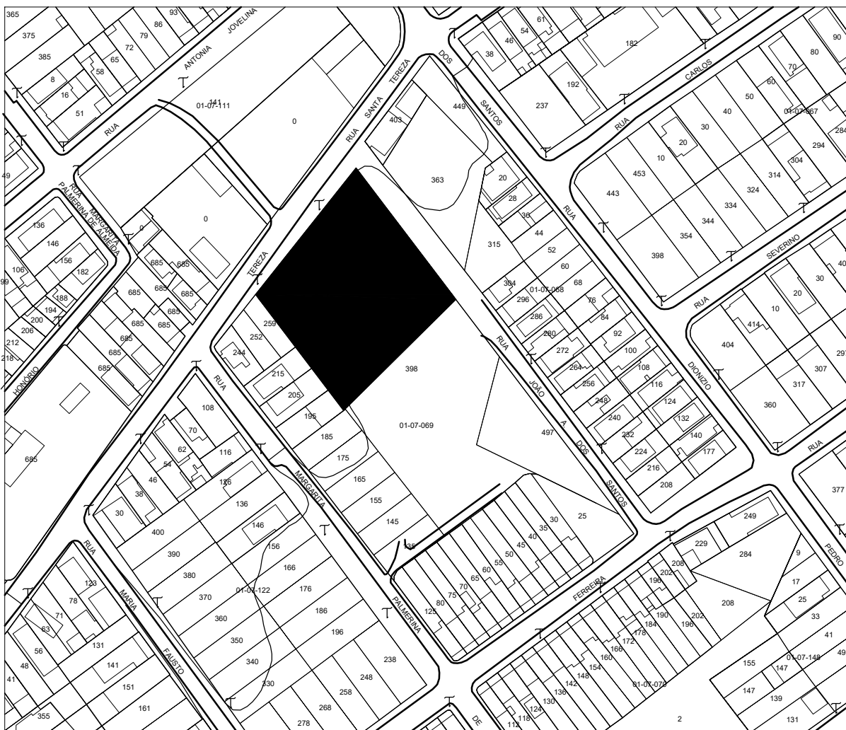
4 Planta de Situação 1 : 1000